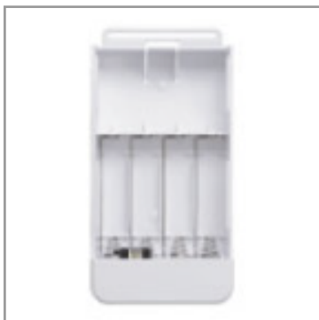
電池パック ラピナビLight用