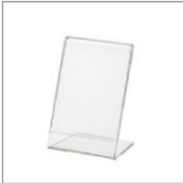
POP用アクリル スタンド(小)L版