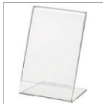
POP用アクリル スタンド(大) A4